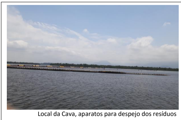
Local da Cava, aparatos para despejo dos resíduos

As empresas responsáveis, respaldadas em opinião do corpo de engenheiros do exército americano (US Army), dessa forma, instalam uma verdadeira “bomba-relógio” no fundo do nosso estuário, que é fonte de vidas marinhas e de subsistência de comunidades ribeirinhas.