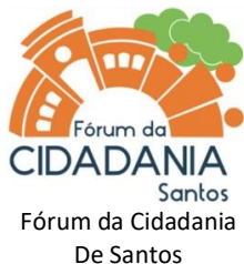
Fórum da Cidadania De Santos