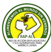
RAP-AL - Uruguay