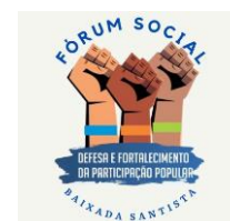
Fórum Social da Baixada Santista