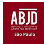
Associação Brasileira de Juristas pela Democracia